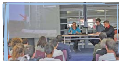
Les finalistes MSA des Portes de Bretagne lors de la présentation de leur projet.

Vainqueur de cette édition, l'équipe des élèves de BTS du lycée La Touche de Ploërmel ( photo ci-après ) a représenté la MSA des Portes de Bretagne à l'occasion de la finale nationale des TPJ qui a été remportée par une classe de seconde Bac Pro du lycée agricole de Coulogne. ■