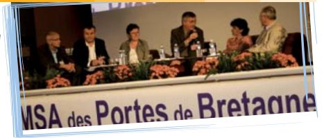
Les délégués témoins lors du débat sur «le mutualisme au quotidien»

La seconde nous a fait partager sa première expérience de Présidente d'échelon cantonal et les apports qu'elle a su tirer d'une formation de responsable suivie dans le cadre de son mandat.