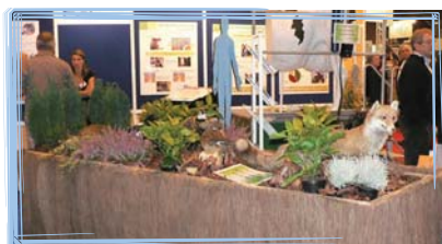
Le stand des MSA bretonnes au SPACE 2009 était consacré aux zoonoses et à la prévention des risques en salle de traite.

Pour plus d'information, vous pouvez vous référer aux fiches "zoonoses" sur le site : www.msaportesdebretagne.fr