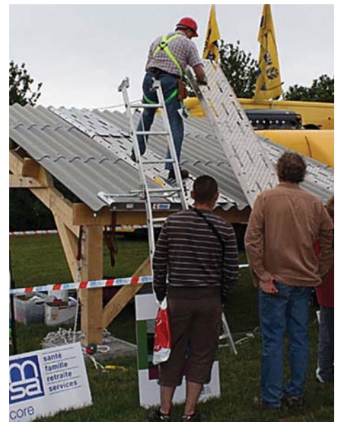
Démonstration au Salon de l'Herbe à Nouvoitou en juin 2009.

* Service Prévention des Risques Professionnels Site 35 : 02 99 01 82 55 Site 56 : 02 97 46 52 36