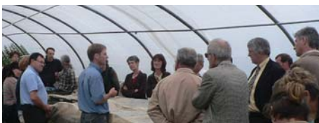
Visite d'EPI par les membres du Comité d'Action Sanitaire et Sociale d'Ile-et-Vilaine en juin 2008

Des travailleurs sociaux sont intervenus en entreprise pour un accompagnement social de groupe. En 2008, ils ont animé et coordonné, au sein de l'association EPI (Entreprise Pour l'Insertion) de Rennes, une session «Bien-être et santé au travail».