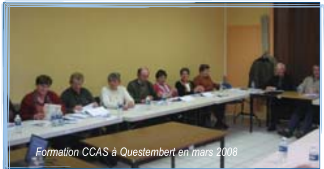
Formation CCAS à Questembert en mars 2008

Organisées en février et mars derniers sur l'Ille-et-Vilaine et le Morbihan, elles ont accueilli environ 260 personnes. La proportion de délégués MSA dans les CCAS a fortement augmenté suite aux dernières élections municipales. Devant ce succès, il est prévu d'organiser de nouvelles sessions sur ce thème en 2009. ■