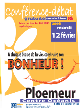
Des conférences en préparation - Elles sont gratuites et ouvertes à tous