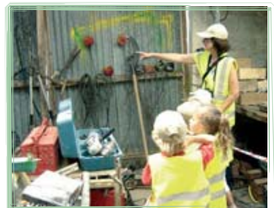
Les enfants, habillés de leur gilet de sécurité et munis de leur livret Prudence à la ferme, visitent les différents ateliers.